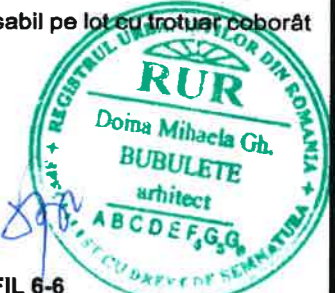
PROFIL 6-6 (conform PUZ Zona Nord)