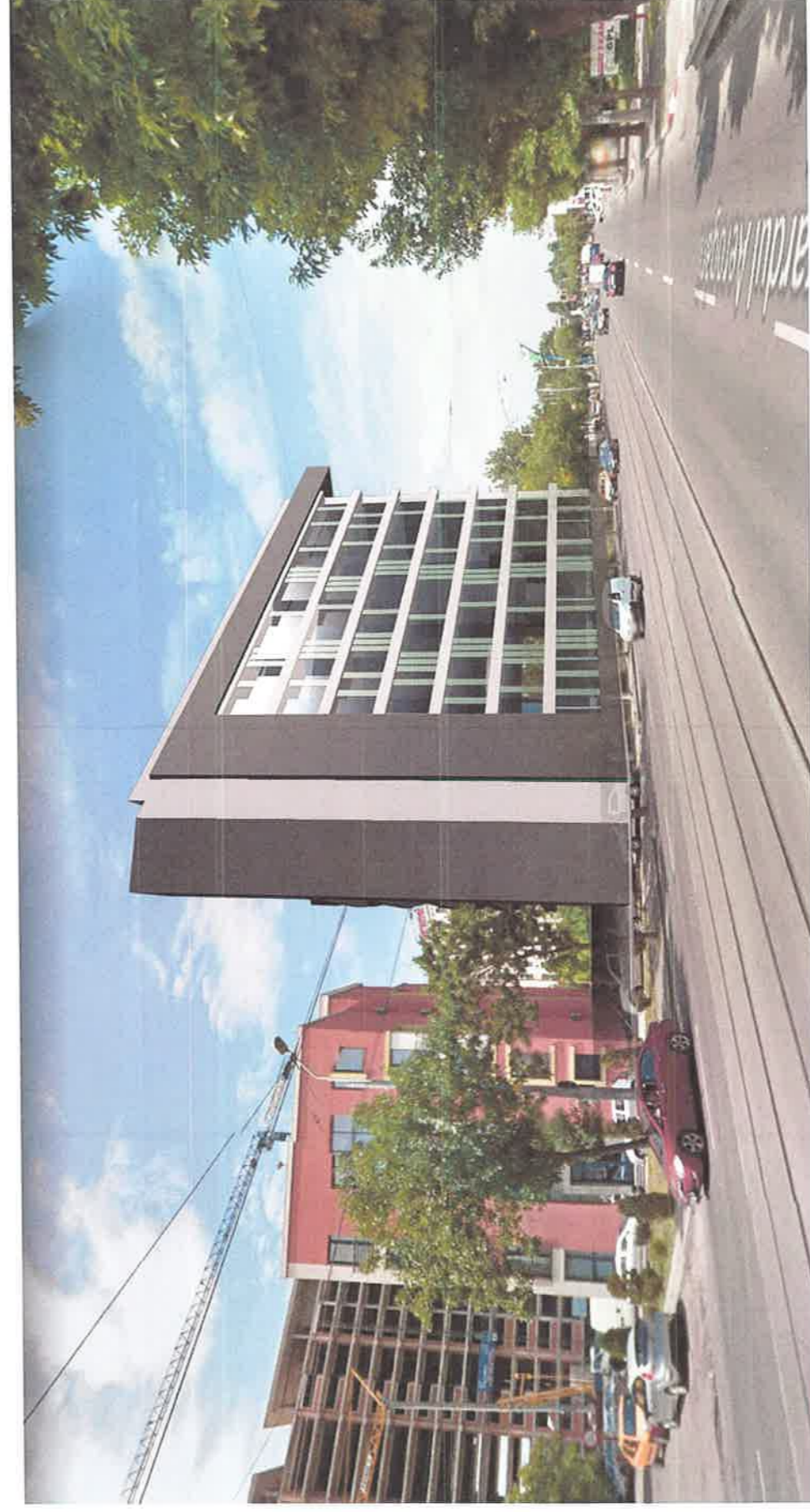
VEDERE STRADALA DINSPRE SUD