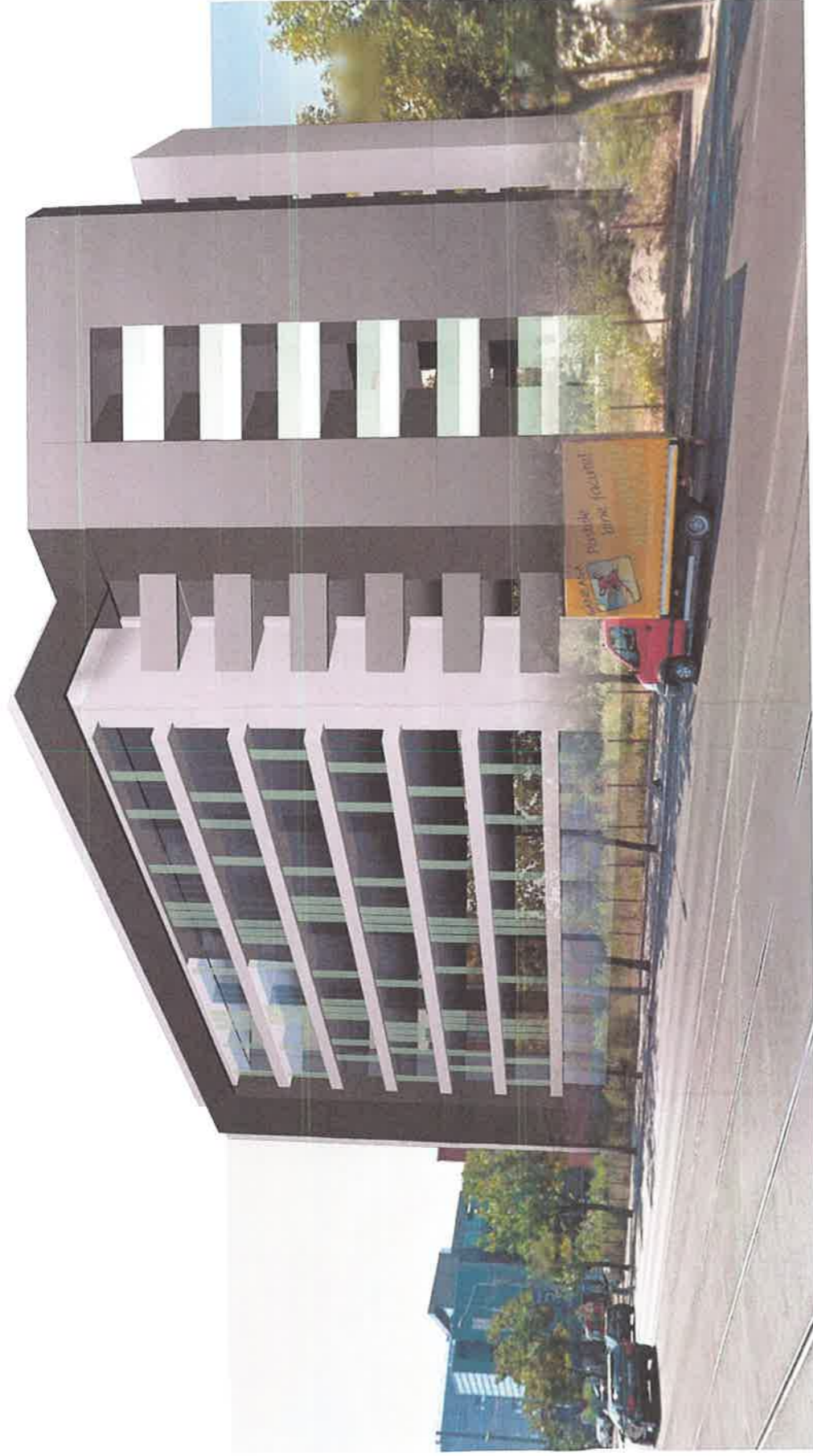
VEDERE STRADALA DINSPRE NORD