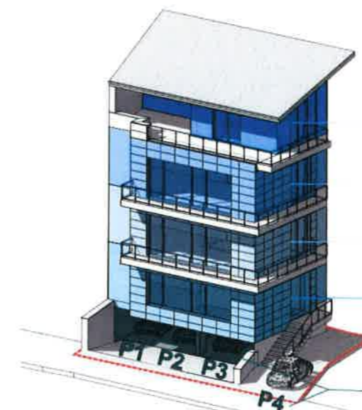
SIMULARE 3D - FUNCTIUNI