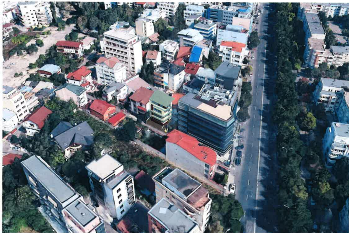
SIMULARE 3D - VEDERE DINSPRE SUD-EST