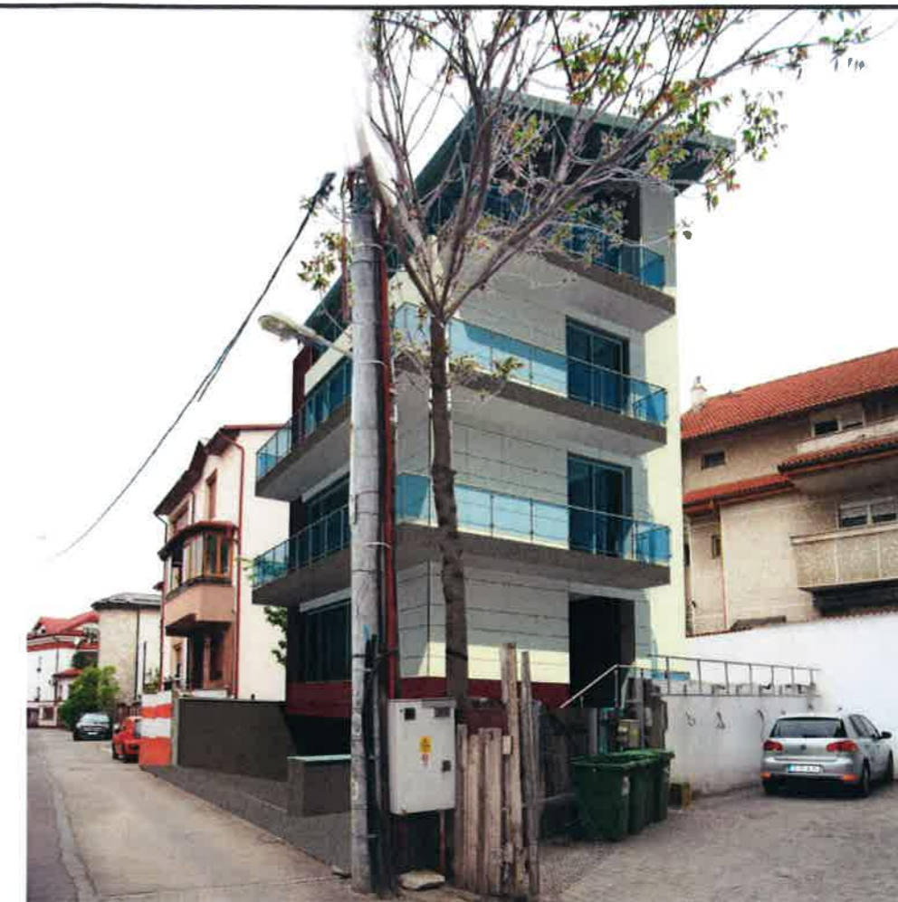
SIMULARE 3D - VEDERE DIN STR. ARDEZIEI