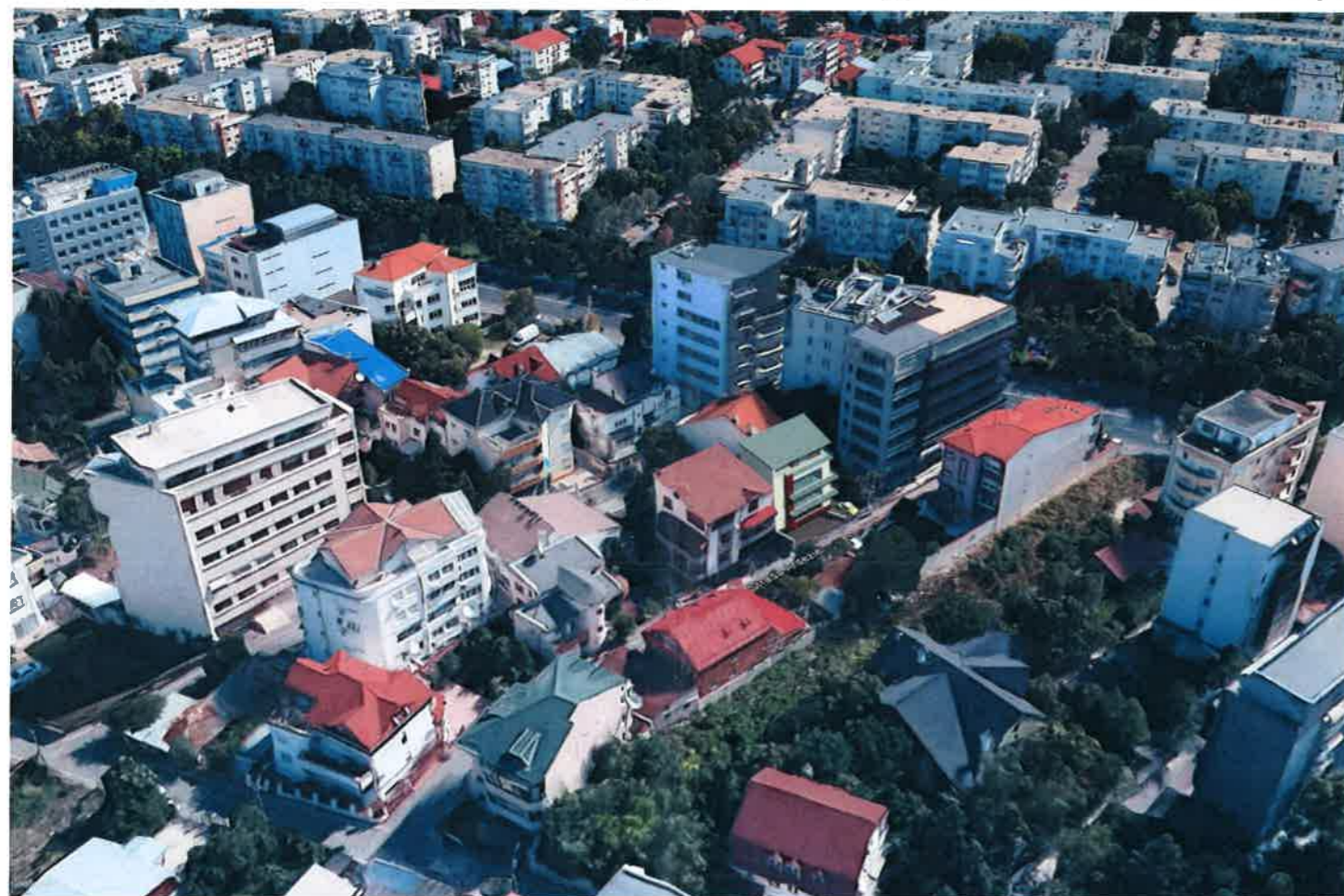
SIMULARE 3D - VEDERE DINSPRE SUD-VEST