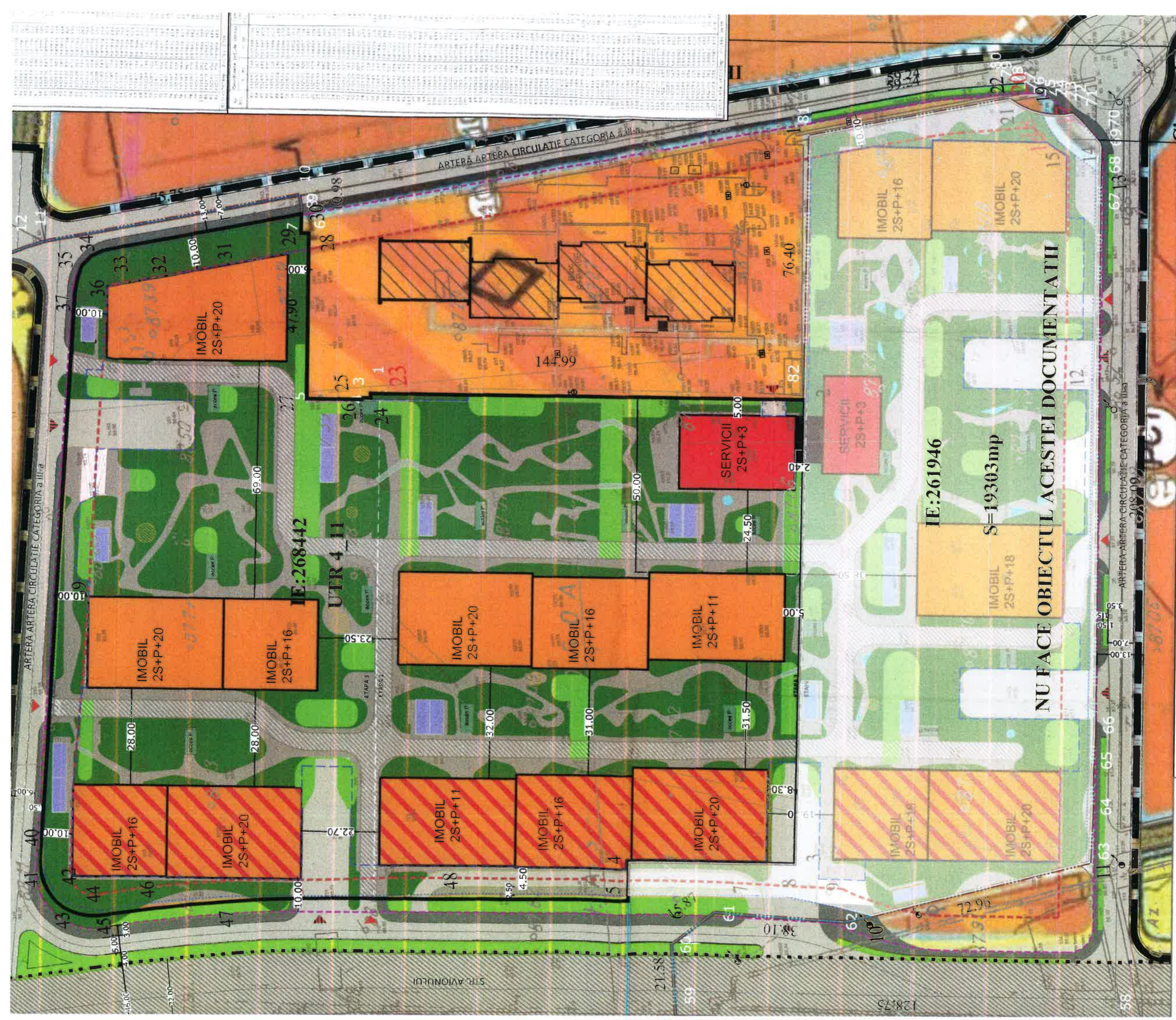
ANT TERITORIAL TEREN CE FACE OBIECTUL ACESTEI DOCUMENTATII - IE:268442