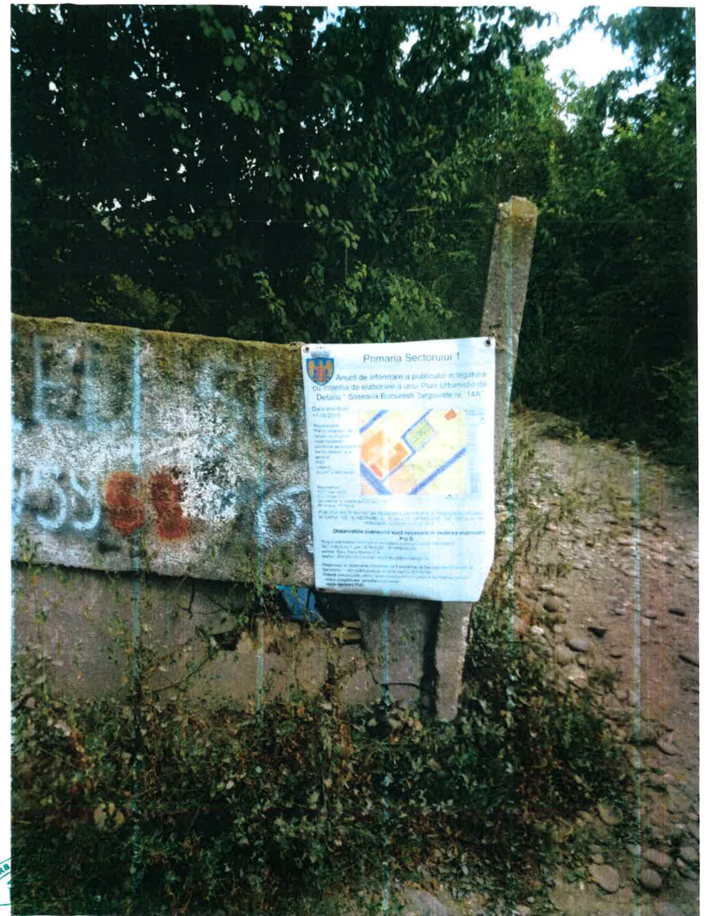
PANOU AMPLASAT PE 11.09.2018