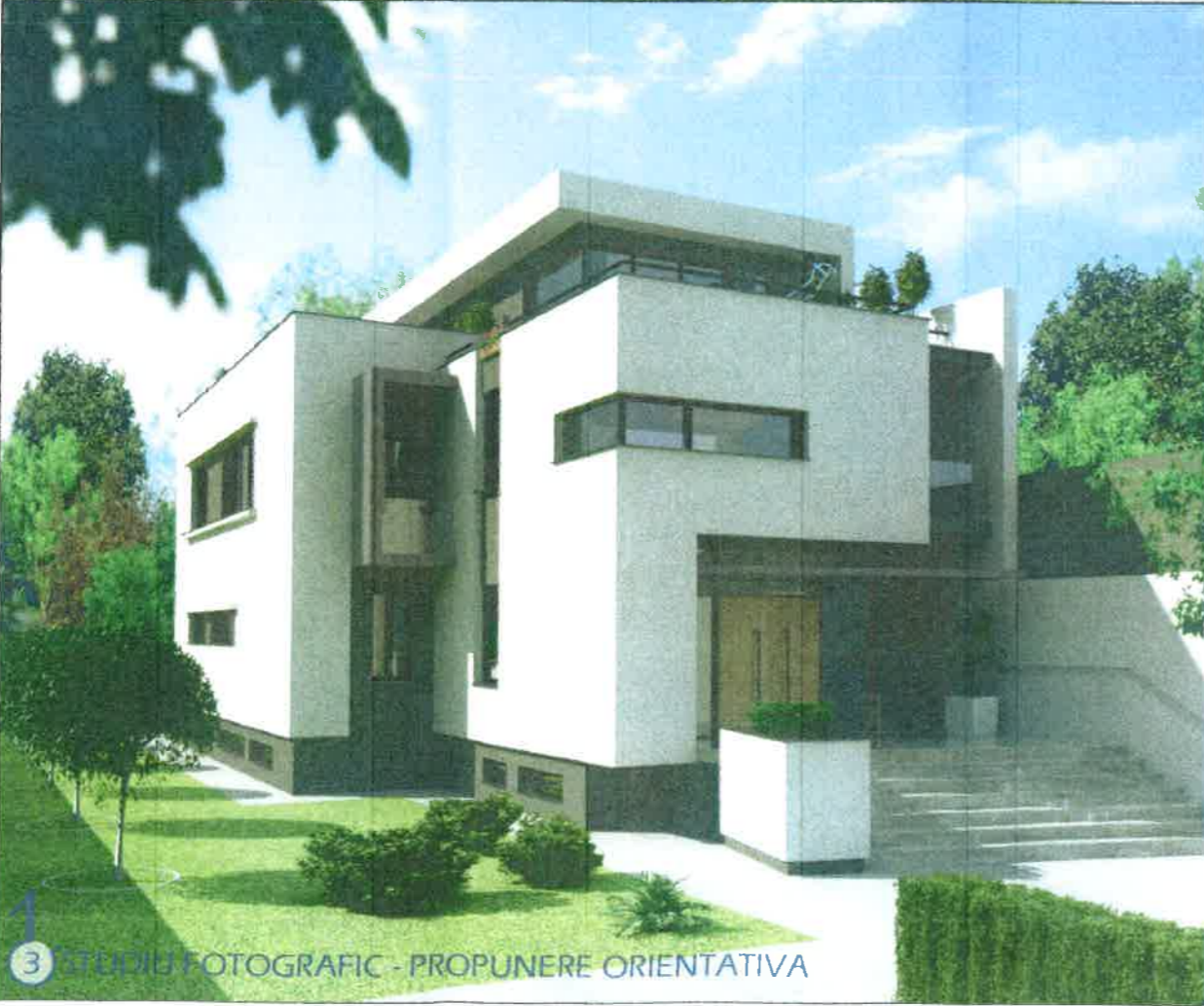
3 STUDIUL FOTOGRAFIC - PROPUNERE ORIENTATIVA