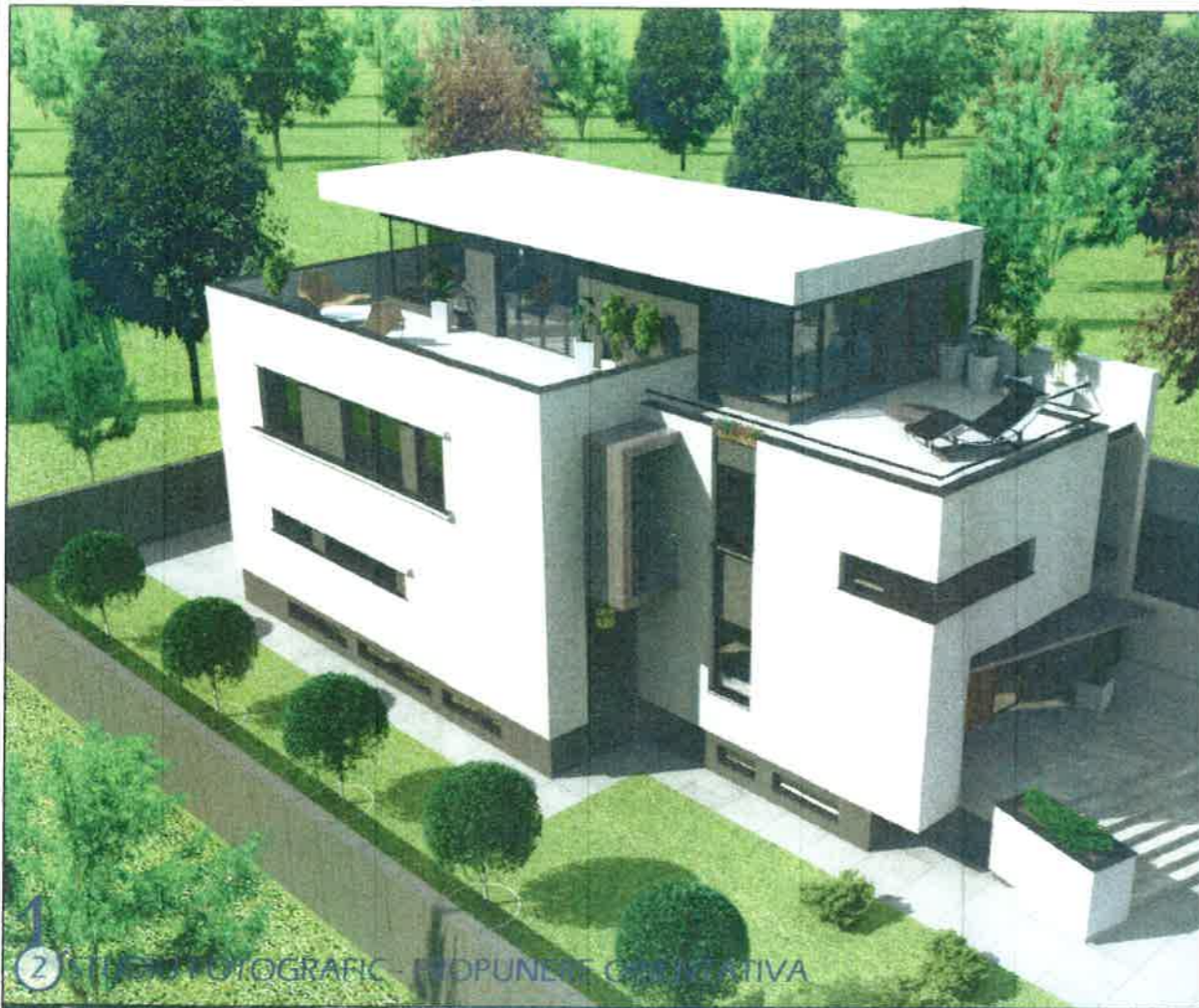
2 STUDIUL FOTOGRAFIC - PROPUNERE ORIENTATIVA