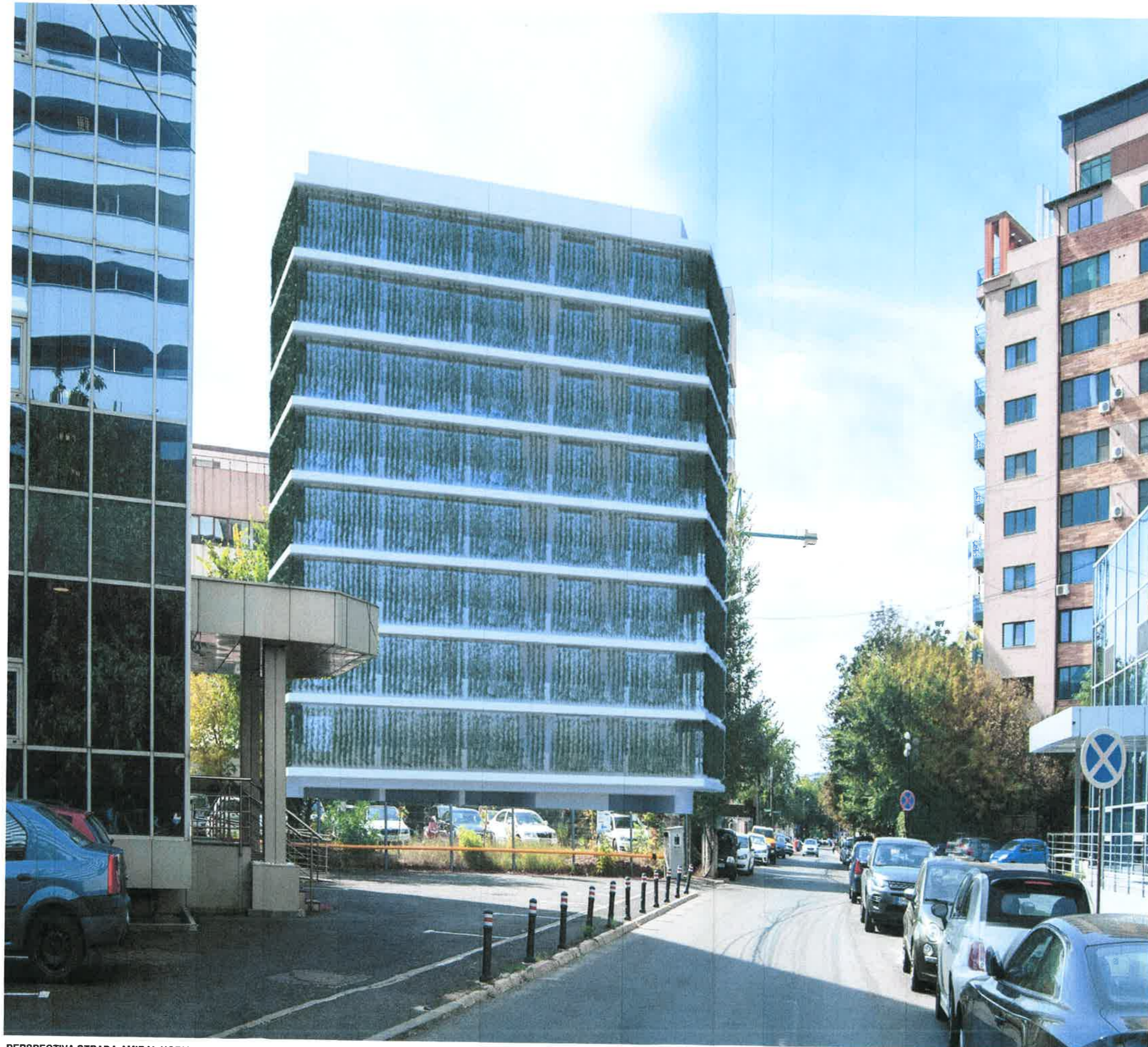
PERSPECTIVA STRADA AMIRAL HORIA MACELARIU