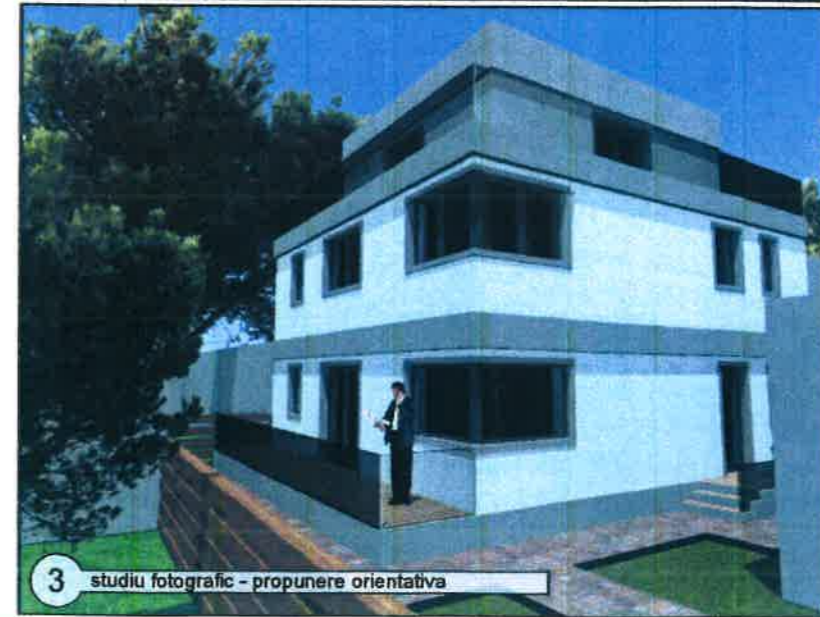
3 studiu fotografic - propunere orientativa