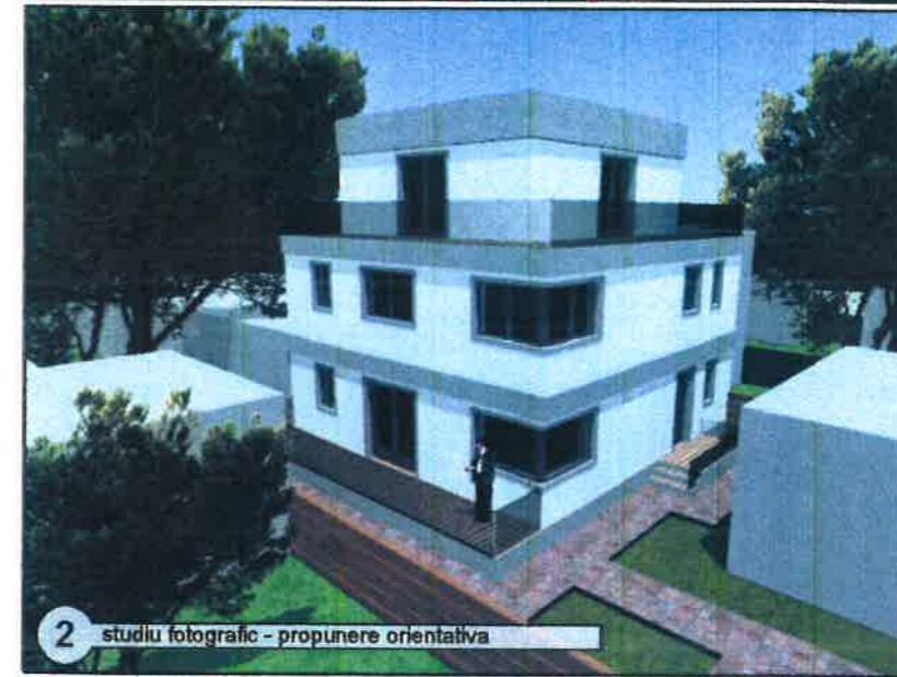
2 studiu fotografic - propunere orientativa