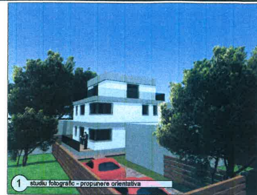
1 studiu fotografic - propunere orientativa

*Suport grafic Plan de Amplasament si Delimitare Imobil in Sistem de Coordonate Stereografic 1970 suprapunere peste extras de plan cadastral sc 1:500, anexa la Certificatul de Urbanism NR. 1804/126/M/45056 din 10.12.2019