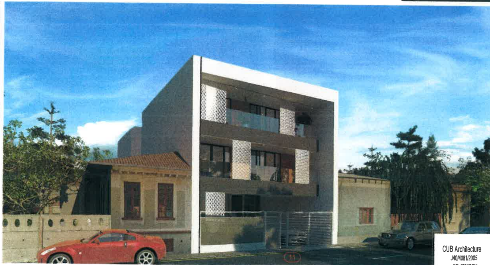
SIMULARE STRADALA EXISTENT + PROPUNERE

CUB Architecture J40/4081/2005 RO 17307485