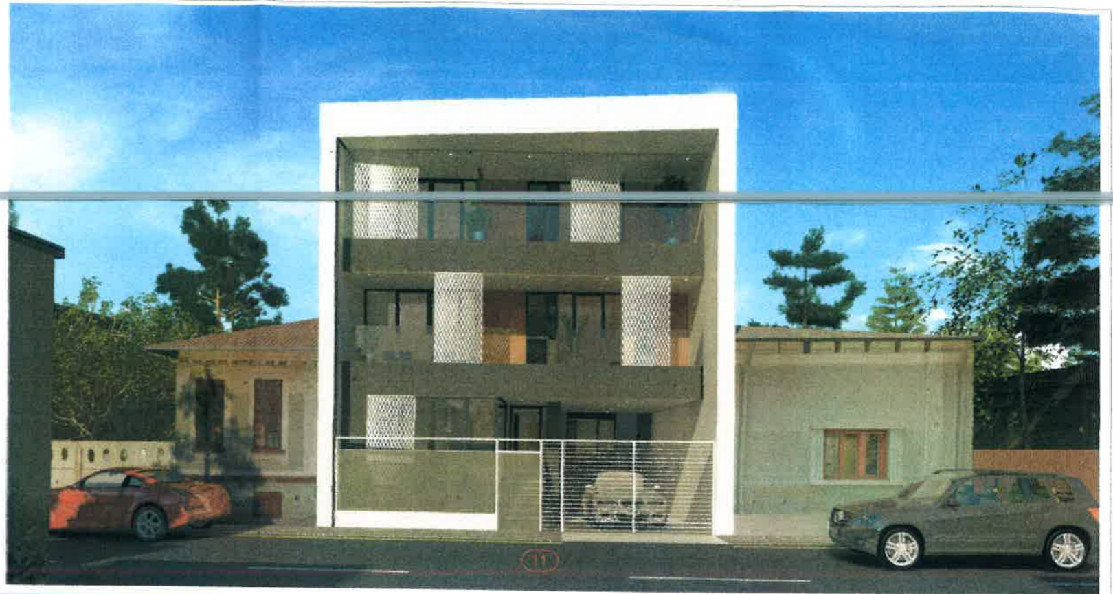
SIMULARE STRADALA EXISTENT + PROPUNERE