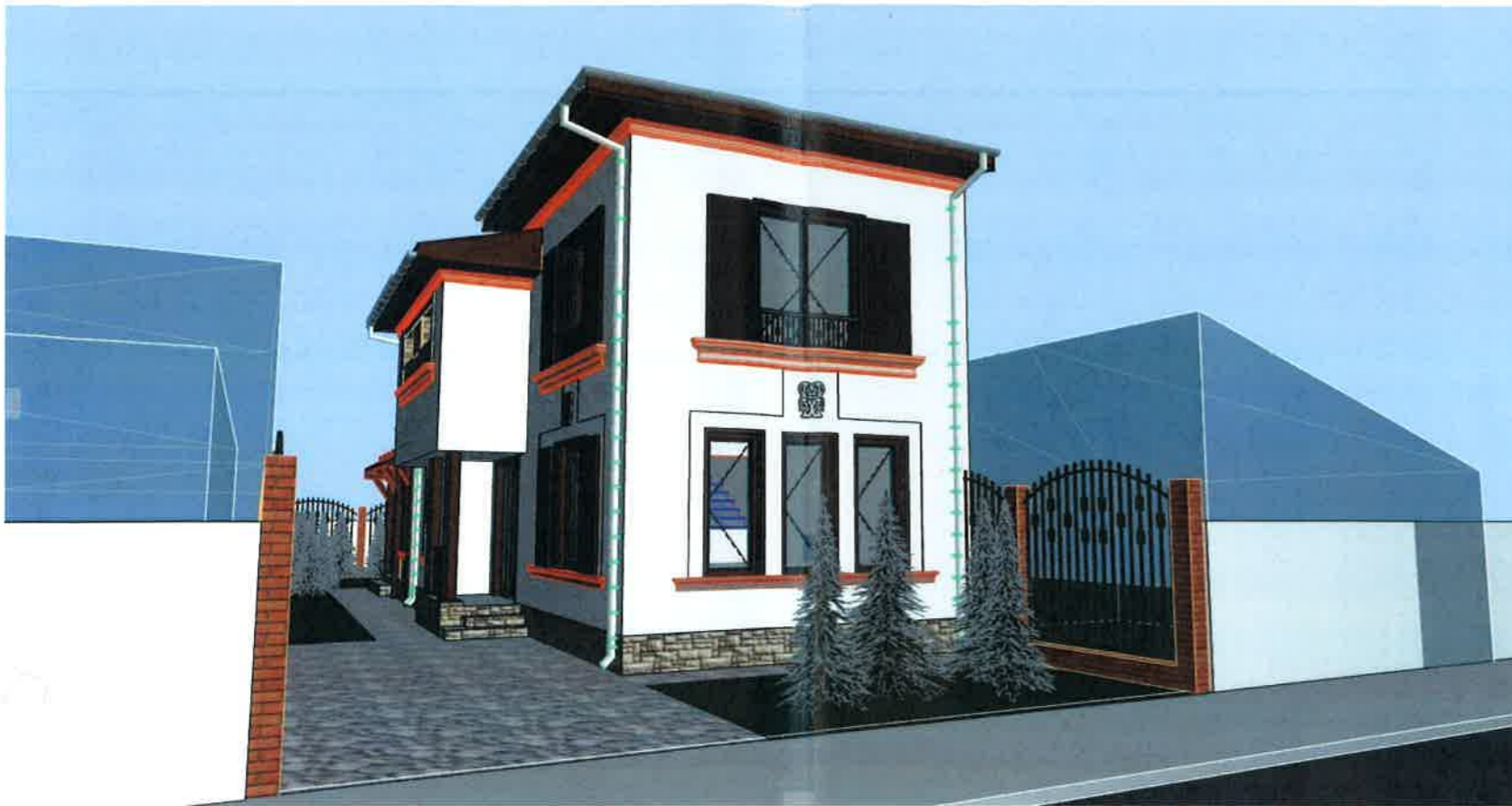
Perspectiva Str. Prahova, Nr 33, Nr 19, Sector 1, Bucuresti