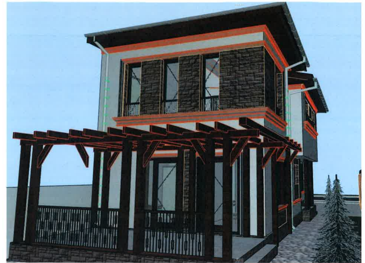
Perspectiva fatada secundara