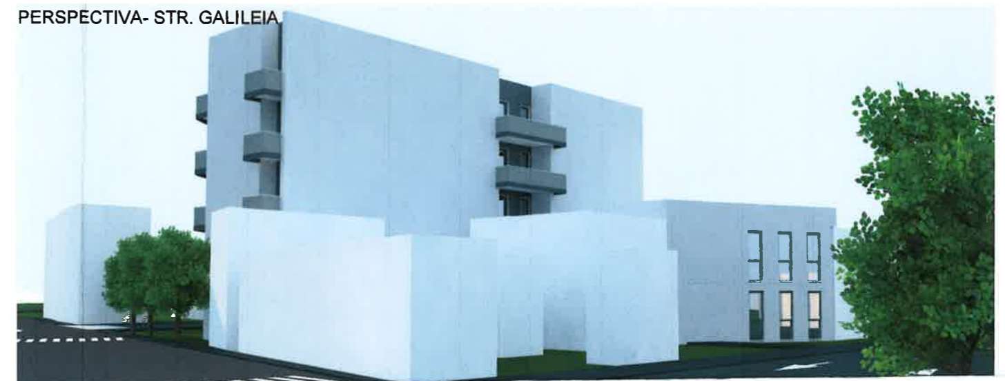
PERSPECTIVA- STR. GALILEIA