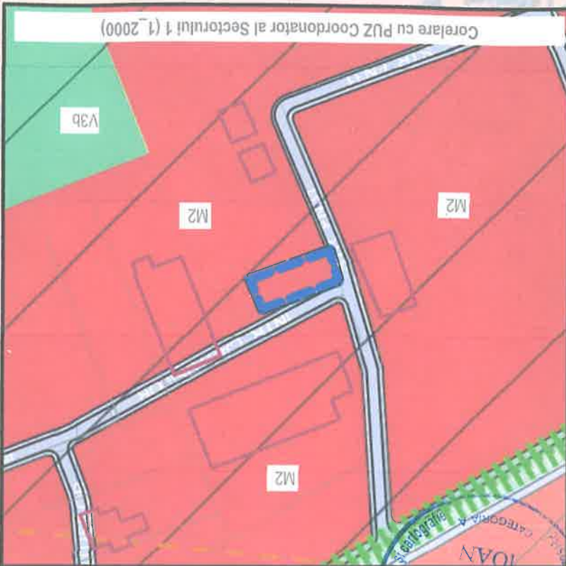
Corelare cu PUZ Coordonator al Sectorului 1 (1_2000)