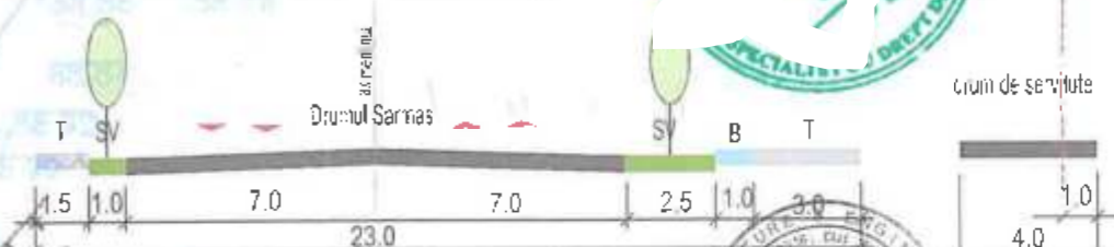
PROFIL TRANSVERSAL - propus prin U.Z. Sos Bucuresti - Targoviste - Lac Straulesti - str. Redea - Drumul Sarmas -