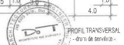
PROFIL TRANSVERSAL - drum de servitute -