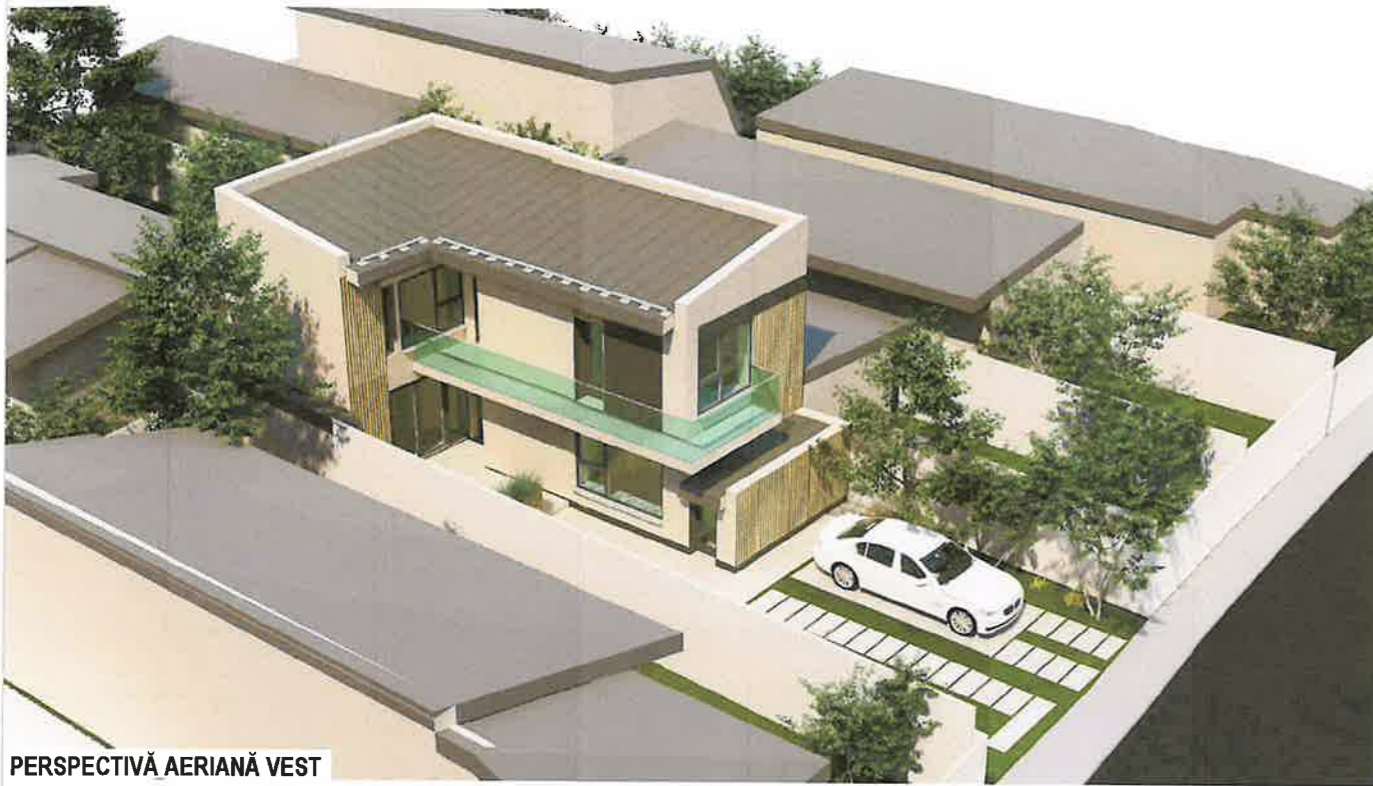
PERSPECTIVĂ AERIANĂ VEST