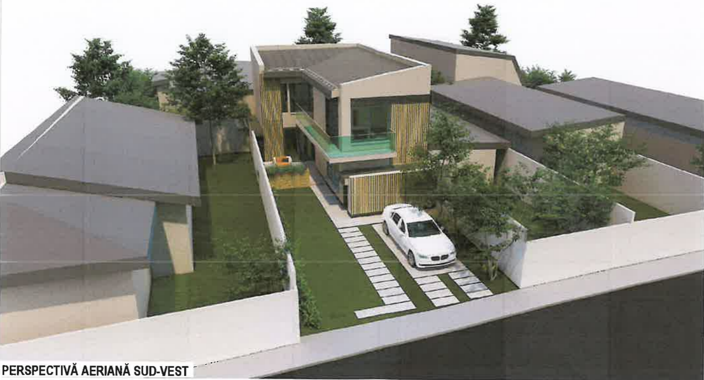
PERSPECTIVĂ AERIANĂ SUD-VEST