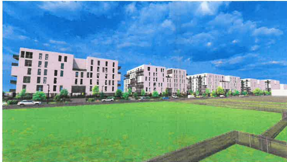
PERSPECTIVA AERIANA LATERALA ELEVATII STRADA PROPU SA