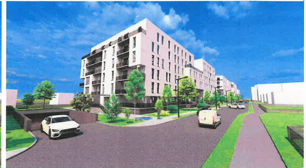
PERSPECTIVA A ANSAMBLULUI DIN STRADA PROPU SA