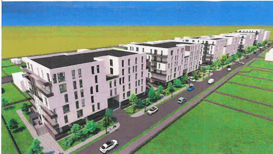
PERSPECTIVA AERIANA LATERALA ELEVATII STRADA PROPU SA