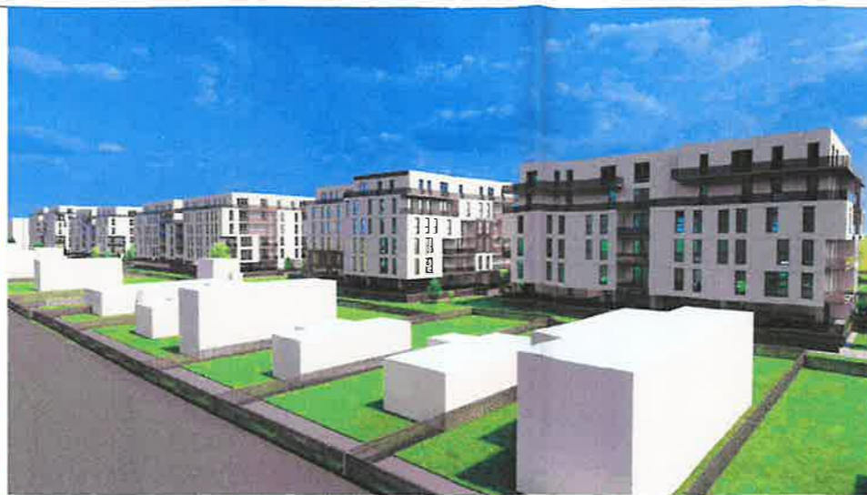
PERSPECTIVA LATERALA ELEVATII SUD-EST