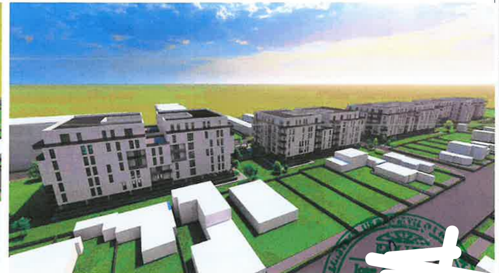
PERSPECTIVA LATERALA DIN DIRECTIA SUD- EST