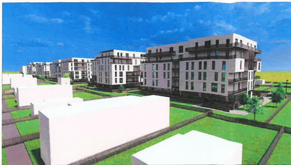
PERSPECTIVA LATERALA ELEVATII SUD-EST