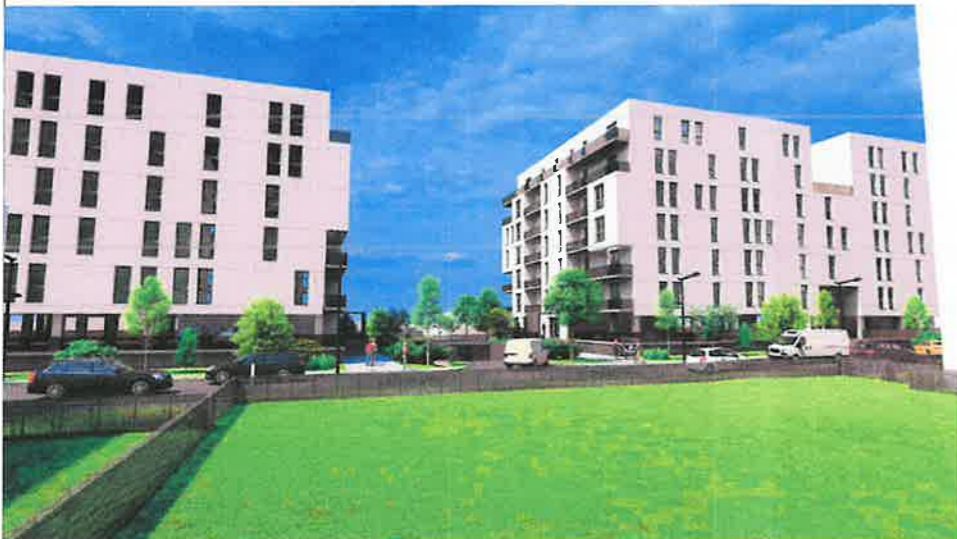
PERSPECTIVA DIN DIRECTIA NORD-VEST