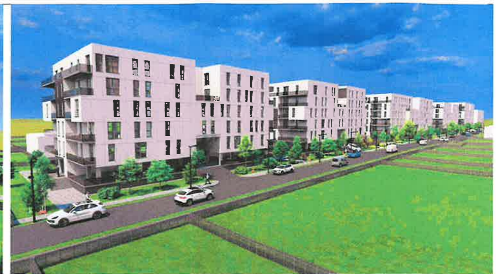
PERSPECTIVA LATERALA DINSPRE STRADA PROPU SA DIRECTIE SUD