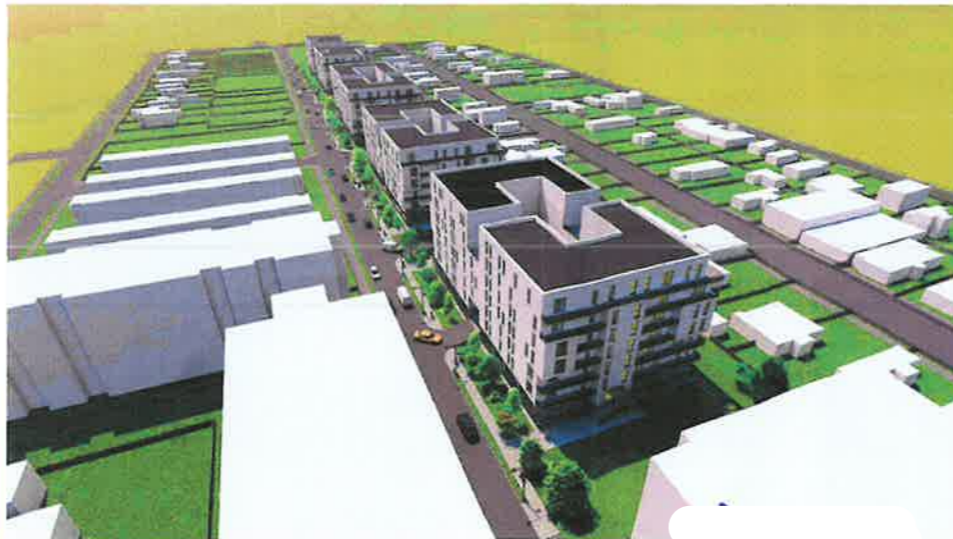
PERSPECTIVA AERIANA DIRECTIE SUD-VEST