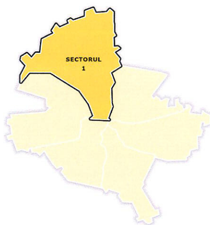
Figura 1 Aria de delegare

Delegarea gestiunii activității de sortare a deșeurilor de hârtie, carton, metal, plastic și sticlă colectate separat din deșeurile municipale se face pentru Sectorul 1 al Municipiului București.