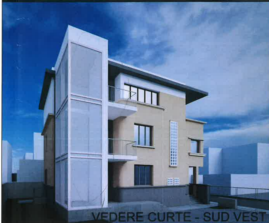
VEDERE CURTE - SUD VEST