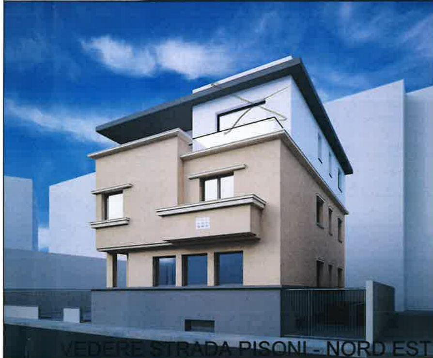
VEDERE STRADA PISONI - NORD EST