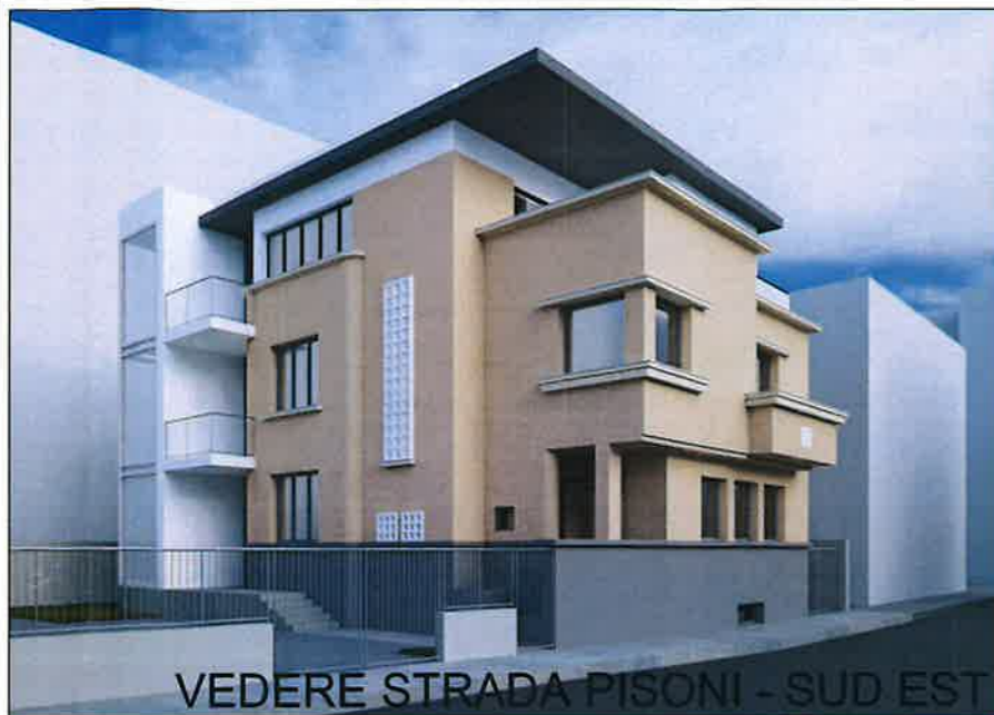
VEDERE STRADA PISONI - SUD EST